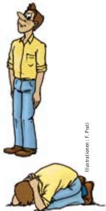
Illustrationen: F. Prati

Der Hund verliert das Interesse an einer Person, die still und unbeweglich ist und entfernt sich. Jede Bewegung hingegen zieht seine Aufmerksamkeit an.